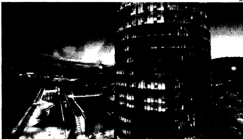
Laboratori. La città catalana si è trasformata in un ambiente aperto all'innovazione