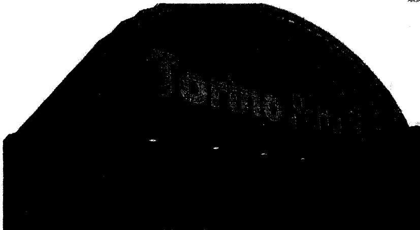
Mobilità. Porta Susa a Torino, la nuova stazione dell'Alta velocità

T ra progetti per l'inclusione sociale, architettura sostenibile, nuove tecnologie innovative al servizio dei portatori di handicap, si è aggiudicata 190 milioni di euro con i bandi del Miur. Quasi un rodaggio per la città di Torino, prima in Italia ad aver riunito privati - università, centri di ricerca, imprese, associazioni di categoria - e amministrazione comunale per disegnare il profilo della città intelligente. Una prova, anche di partecipazione e condivisione. Attraverso la Fondazione Torino Smart City, partecipata al 100%, il Comune ha infatti radunato i propri dirigenti e amministratori e 350 stakeholders. È il progetto Smile, acronimo di Smart Mobility, Inclusion, Life & health e Energy. Vale a dire mobilità sostenibile, inclusione, salute ed energia. Che poi sono le tematiche trattate, con decine di incontri per 10mila ore di lavoro, tra febbraio e giugno. Ne è venuto fuori un tomo di 700 pagine di proposte - grazie